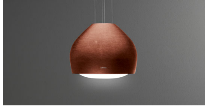
Deze afbeelding is enkel ter info Het kan zijn dat dit niet beantwoordt aan de geselecteerde versie